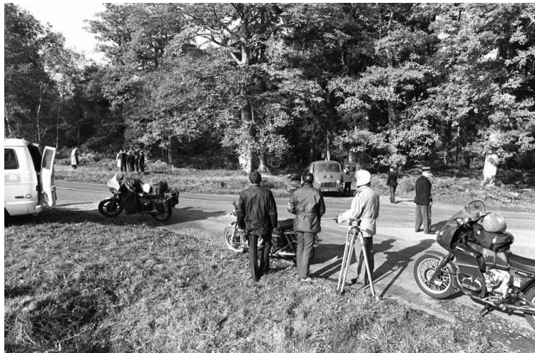
Le 30 octobre 1979, près de Rambouillet, là où le corps de Robert Boulin avait été retrouvé.

Rien ne prouve selon lui que Robert Boulin s'est noyé, encore moins que cela se soit passé à l'étang du Rompu. Et pour cause ! Les poumons – et l'eau qu'ils auraient pu contenir – n'ont jamais été analysés. « La conclusion du suicide est apportée par l'hypothèse d'une immersion, immersion qui n'est elle-même pas prouvée », résume le légiste. Un raisonnement qui fait écho aux souvenirs des premiers témoins, comme ce médecin du Samu qui se souvient d'un homme « à quatre pattes » dans l'étang, tête « hors de l'eau ». « On aurait dit qu'on le sortait d'une malle », a-t-il expliqué au juge en 2016.