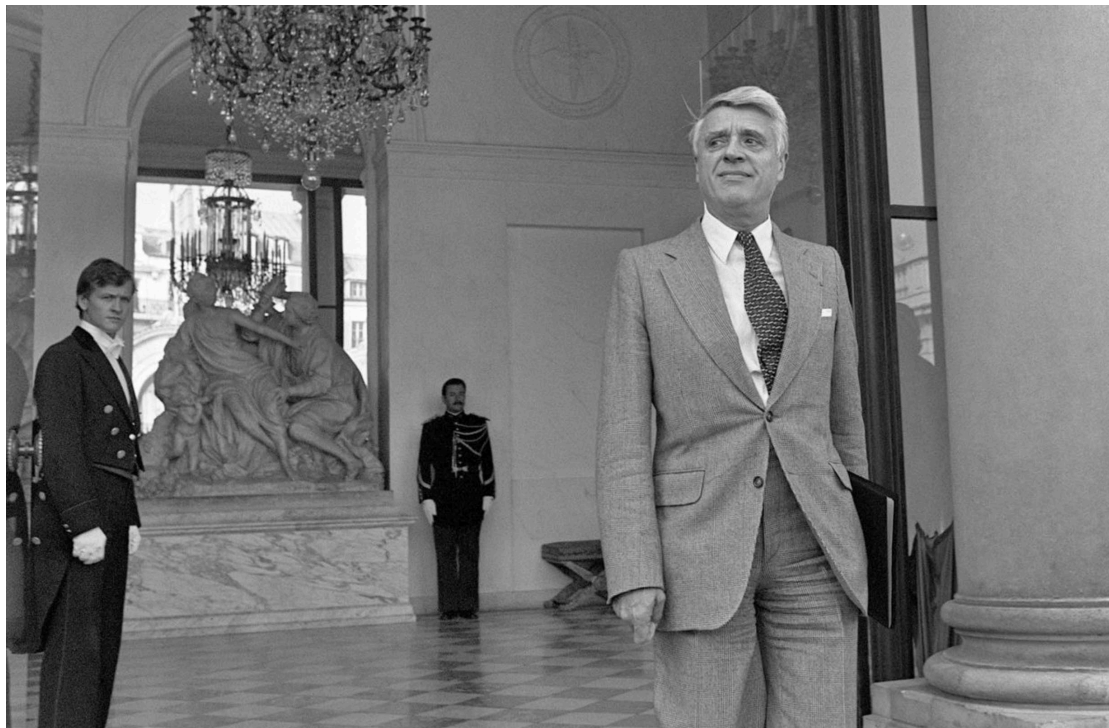
Robert Boulin était ministre du Travail quand son corps a été retrouvé, fin octobre 1979, dans un étang près de Rambouillet.

Quarante ans après la mort du ministre Robert Boulin, un juge d'instruction a repris le dossier depuis 2015. L'hypothèse officielle du suicide a de plus en plus de « plomb dans l'aile ». Un mystère criminel et politique à retrouver, ce mardi soir, dans « l'Heure du crime » sur RTL.